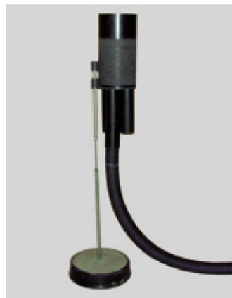
Wasserdurchführungsrohr mit VARIO-fix-System